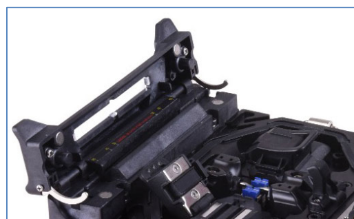
Время усадки -15 с