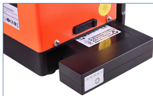
Емкость батареи -5200мАч